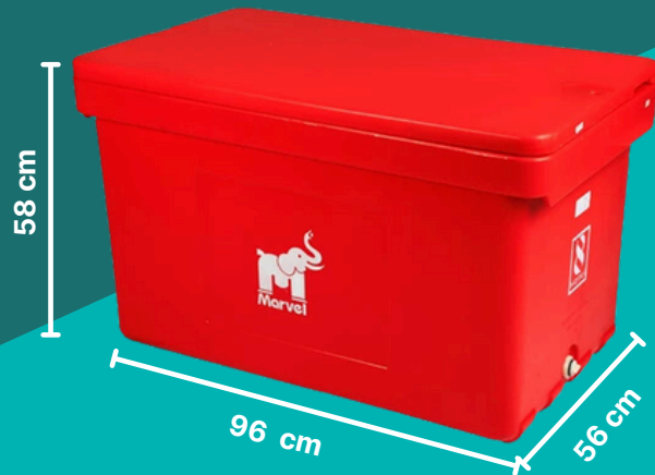
• 200 Liter