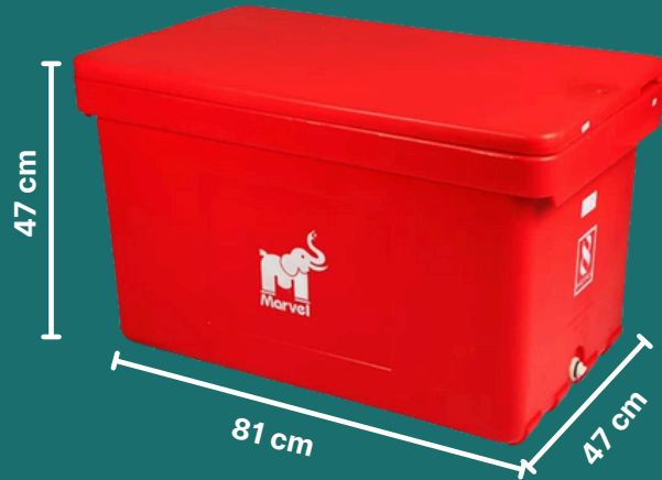
• 100 Liter